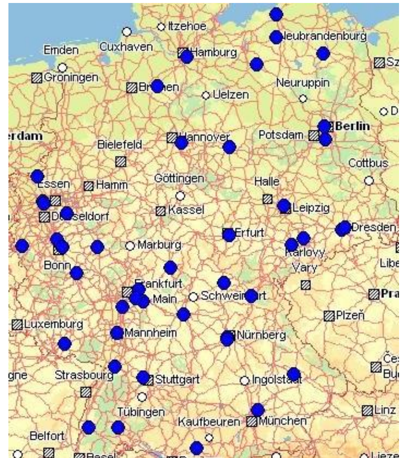
Standorte der 47 Depots

Die Standorte der einbezogenen 47 Depots sind in der nebenstehenden Karte abgebildet.