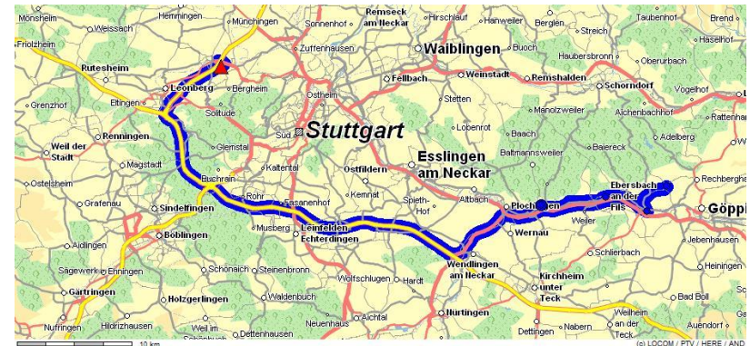
Tour mit hohem mautpflichtigen Anteil