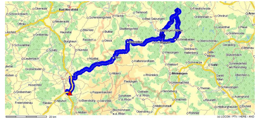
Tour mit geringem mautpflichtigen Anteil

Die oben stehende Abbildung zeigt exemplarisch eine Tour mit einem niedrigen mautpflichtigem Anteil, die unten stehende Abbildung hingegen zeigt eine Tour mit einem hohen Anteil an mautpflichtigen Strecken.